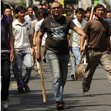
Uygur avına çıkan sivil Çinliler