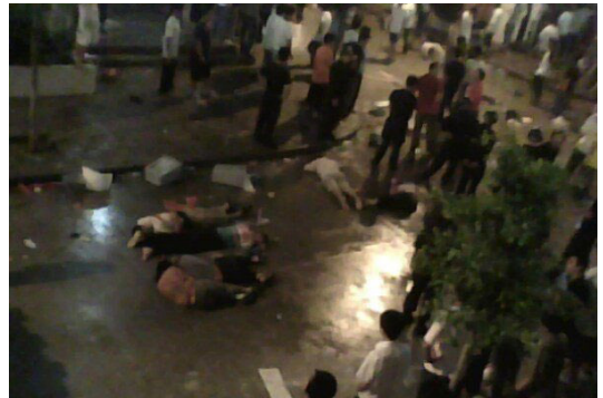
5 Temmuz 2009 olaylarına dair görüntü