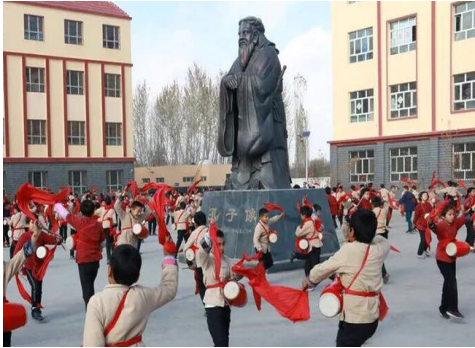
Uygur çocukları çinileştirme politikası

ABD Dışişleri Bakanlığının dile getirdiği bir başka baskı yöntemi de okullarda sadece Han Çinli kültürünün, Çin dili ve ideolojisinin çocuklara zorla öğretilmesiydi. Raporda, "Çin hükümeti, Uygur ve diğer Müslümanların yabancı ülkelere zorla geriye gönderilmesini istedi. Bunun sonucunda geri gönderilen bazıları gözaltına alındı" denildi.