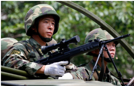
Uygur avında olan keskin nişancı

5 Temmuz Urumçi olaylarında şehit edilen, tutuklanıp, muhtemelen katledildikleri için, bir daha kendilerinde haber alınamayan Doğu Türkistanlı kardeşlerimize rahmet diliyorum. Her Doğu Türkistanlı'nın 5 Temmuz Urumçi olaylarını hafızasına nakşetmesini, Urumçi olaylarını unutmamanın tükenmek olacağını hatırlardan çıkarmaması gerektiğini bilvesile ifade ederken, olayların 11. yılında zalim Çin yönetimi yetkililerini tekrar kınıyor, uluslararası insan hakları teşkilatlarını bölgede yaşanan insan hakları ihlallerini ortaya çıkarmaya ve sorumluların cezalandırılmasına dair ivedilikle göreve davet ediyorum.