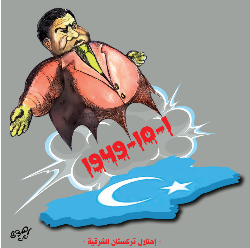
- إحتلال تركستان الشرقية -

وقد كتبوا أن استهداف أحد المشاركين يقوض قدرة البرنامج على مواصلة هذا العمل. إننا ندعوكم إلى توضيح وضع السيد أسد وإطلاق سراحه لأسرته في أقرب وقت ممكن.