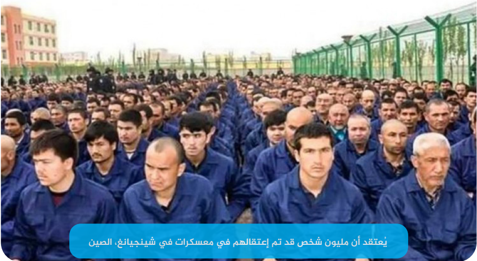
يُعتقد أن مليون شخص قد تم إعتقالهم في معسكرات في شينجيانغ، الصين