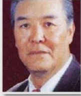
إعداد : شمس الدين أقسوآوات

من أشهر أشعاره (بالأيغورية) : كُتلا بولسا كُرن نئممس، كُله كپراقى ولمسا ، كُپلا بولسا كُپ نئممس، مومزمن -تراقى بولمسا . تكى پتلاپ ما نئممش لئيقم، موزمن تك بول پ، نرلا بولسا نر نئممس، نادم سياتى بولمسا، نادمى نادم نئمكىن مئىنى، هر سنى نئممس ، هر سنى بر سر زمرت لئرز دلئنى، چراقى بولمسا، بر مسال: پانوسكى نر، شام چراقسىز يورزماز، نر چاقامز، شام چراق، پهلك ده ياغى بولمسا.