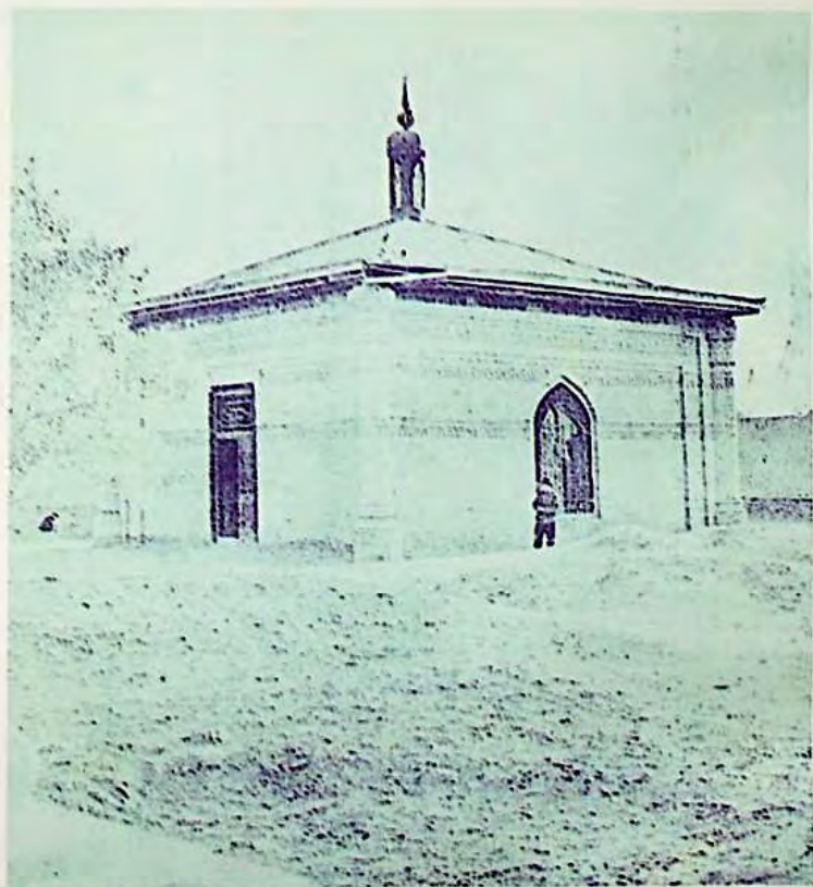
قاراخانلار سۇلالىسىنىڭ ئىسلام دىنىغا تۇنجى ئېتىقاد قىلغان خانى سانۇق بۇغراخاننىڭ قەبرىسى ( ھازىرقى ئاتۇشنى )