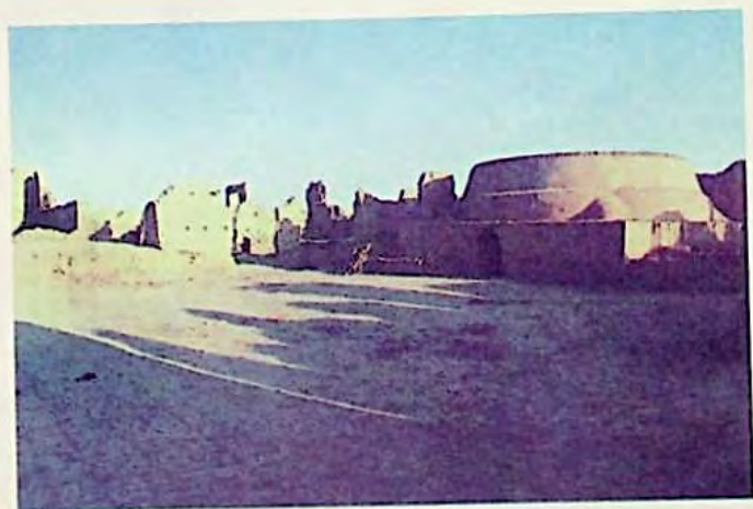
ئىدىقۇت ئۇيغۇرلىرىنىڭ پايتەخت خارابىسى ( ھازىرقى تۇرپاندا )