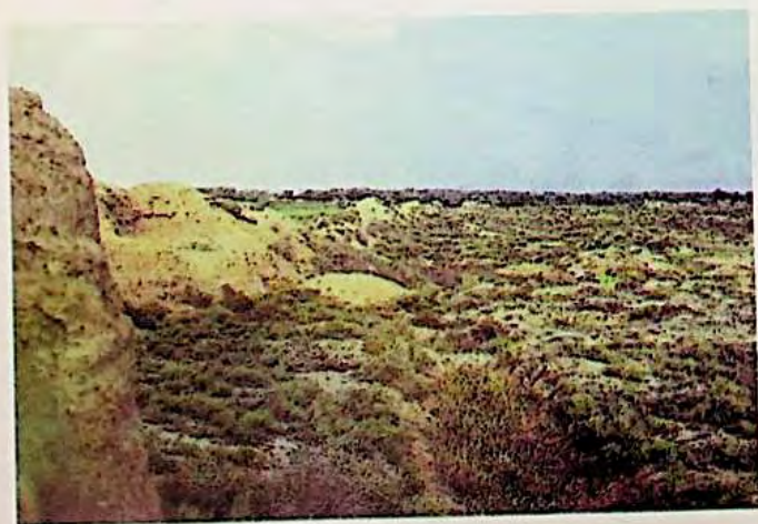
بېشبالق شەھرى خارابىسى ( ھازىرقى جىمىسار ناھىيىسىدە )