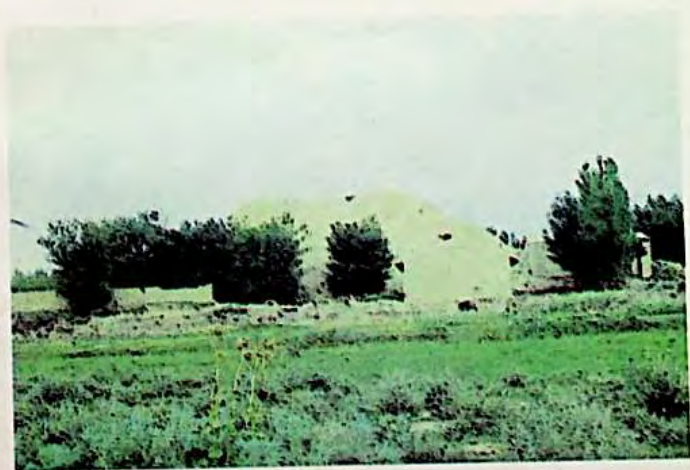
بېشالوق شەھىرى ئەتراپىدىكى ئۇيغۇر بۇددا ئىبادەتخا. نسى ( ھازىرقى جىمىسار ناھىيىسىدە )