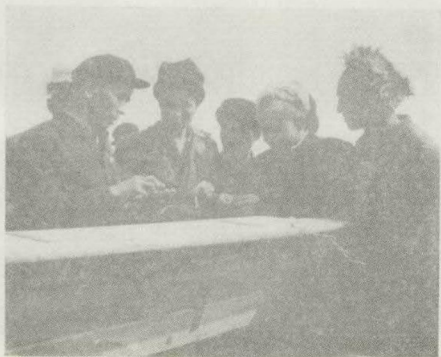
ئاپتور دېھقانلار بىلەن بىللە.