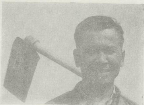
ئاپتور ئەمگە ككە كېتىۋاتىدۇ.