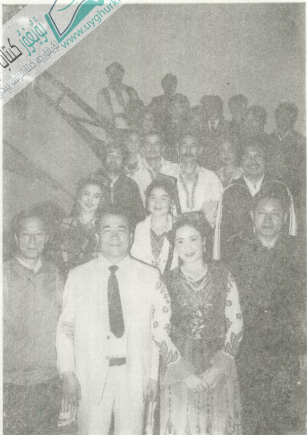
ئاپتور ئارتىسلار بىلەن بىللە (جۇخەي شەھىرىدە)