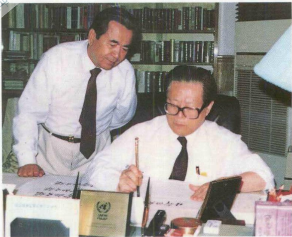
باش شۇجى جياڭ زېمىن ئاپتورغا مۇشۇ كىتابنىڭ ئىسمىنى يېزىپ بەردى.