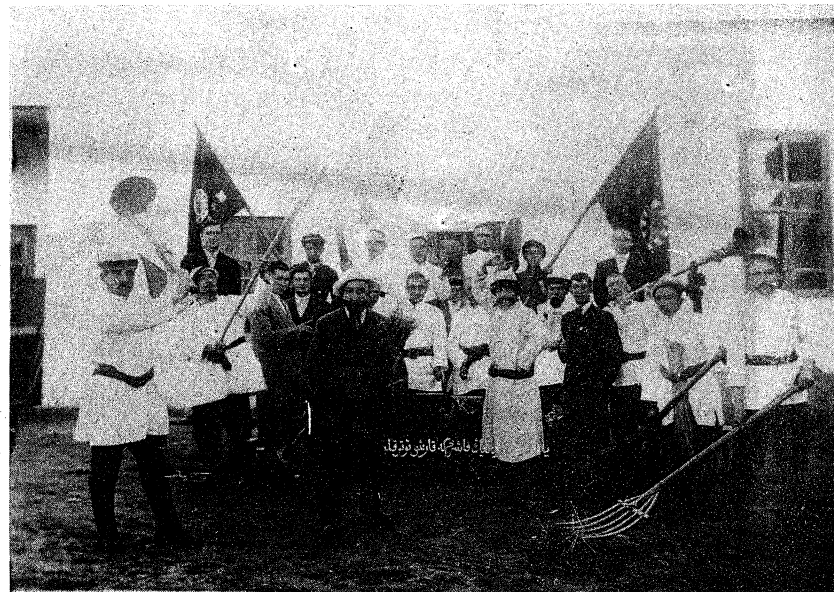
ياپونغا قارشى ئۇرۇش مەزمۇن قىلىنغان كوجا تىياتىرىدىن بىر كۆرۈنۈش