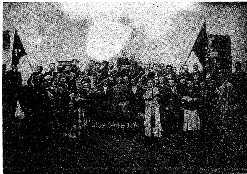
ئاپرىل بايرىمىغا بېغىشلانغان كوجا تىياتىرىدىن بىر كۆرۈنۈش