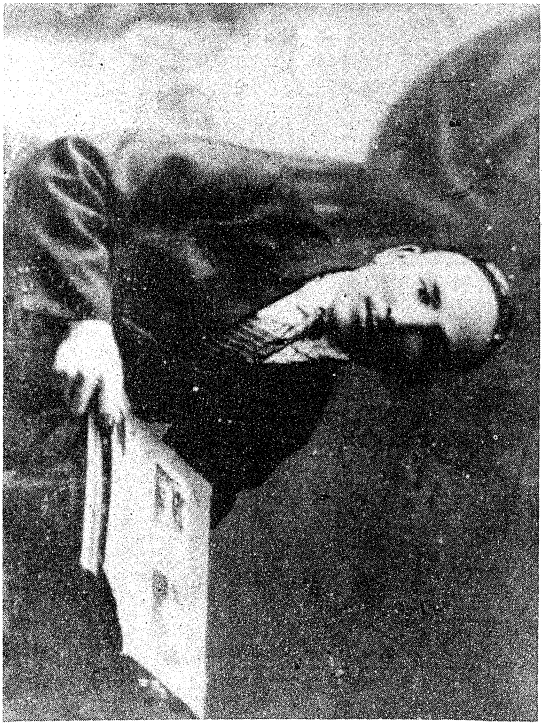
مەرىپەتچى، تەرەققىيپەرۋەر زات — مەتتىياز مەخسۇم