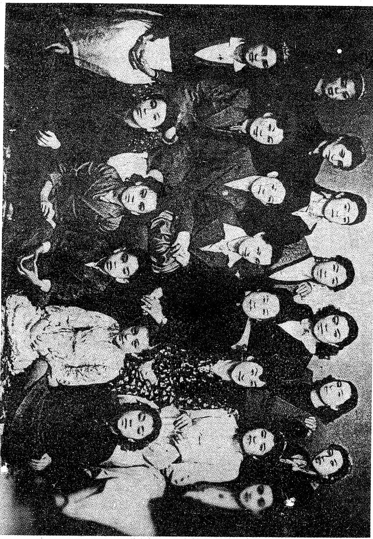
1948 - يېشىلى ئىچكىرى ئۆلكىگە ئىژۇرە تىلگەن تۇنجى شىنجاڭ مىللىي سەنئەت گۇمبىسى

نەنجىن، شاڭخەي، خاڭجۇ، تەبىئەت قاتارلىق شەھەرلەردە ئالتە ئاي دېگەندەك ساياھەت قىلىپ، ناھايىتى كۆپ